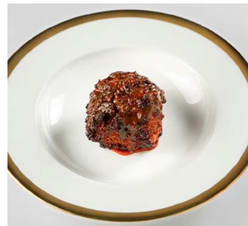
Ein Manifest: «Pane e Peperone».