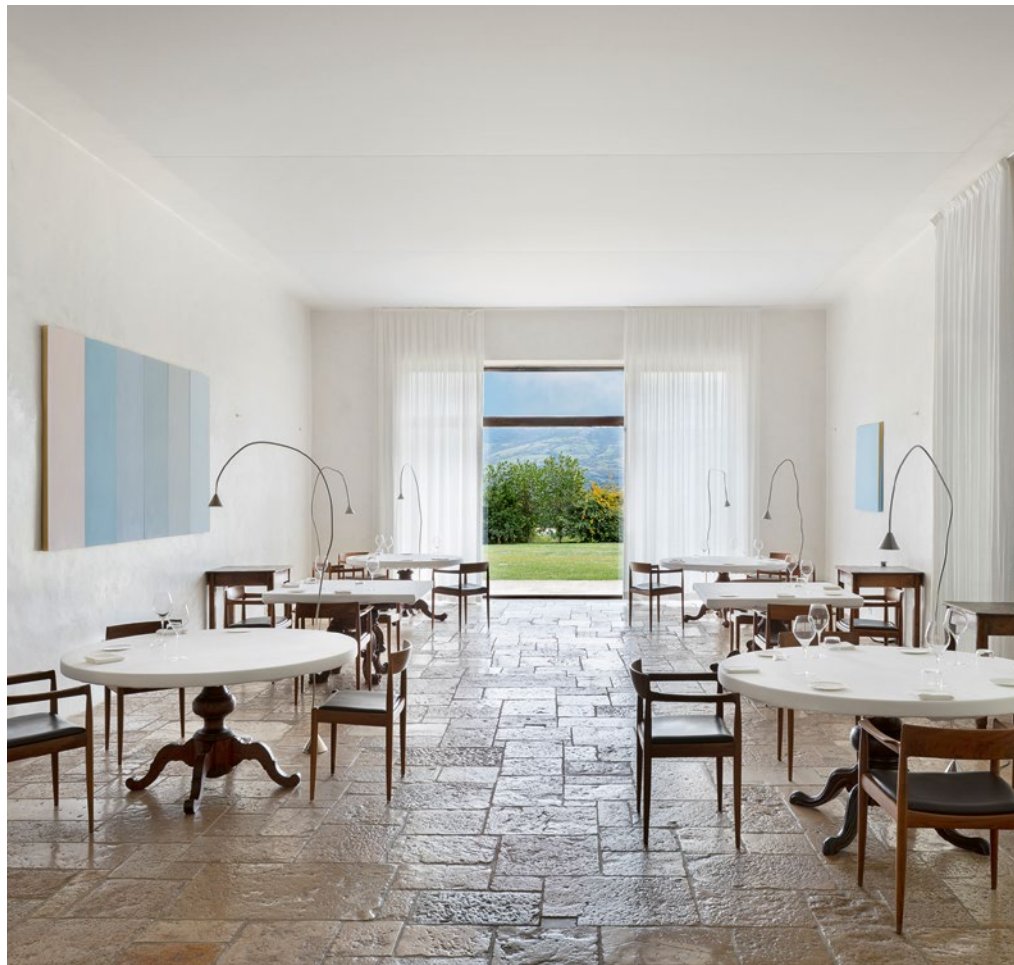
Der asketische Speisesaal im «Ristorante Reale».