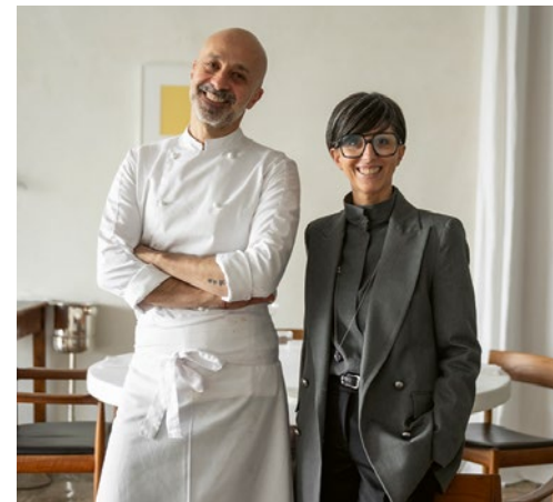
Dreiternekoch Niko Romito mit Schwester Cristiana.