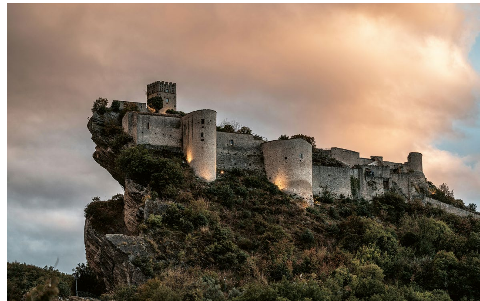
Die Burg von Roccascalegna in der abruzzesischen Provinz Chieti.

LINKE SEITE: Die raue Hochebene Campo Imperatore im Nationalpark Gran Sasso und Monti della Laga wird auch «kleines Tibet» genannt.