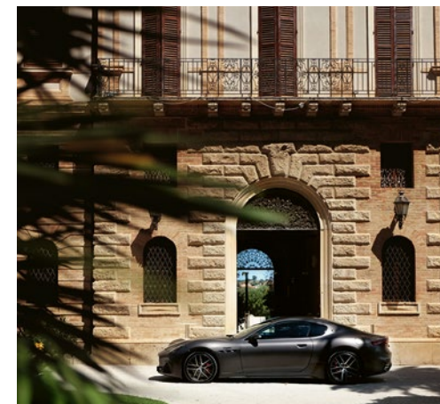
Dolce Vita in der «Villa Corallo».