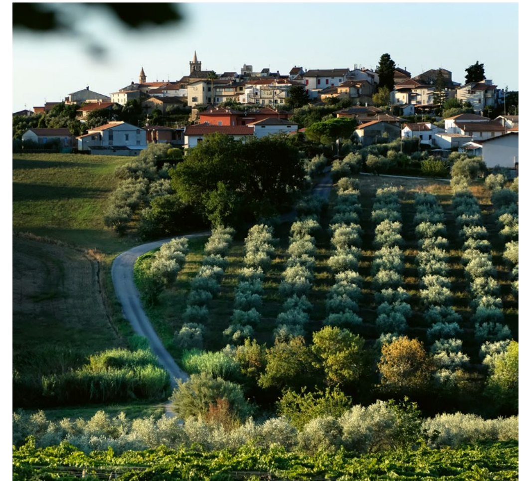
Intakte Biodiversität auf dem Weingut von Emidio Pepe in Torano Nuovo.